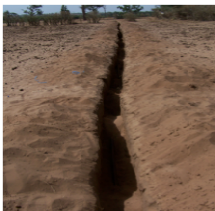
Tranchée pour l'eau