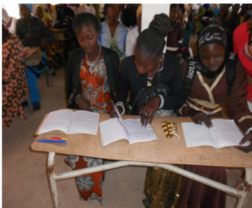
Conditions de travail difficiles faite par les élèves

Les équipements en tables, chaises, tableaux, seront financés par l'Inspection Académique de la région de THIES.