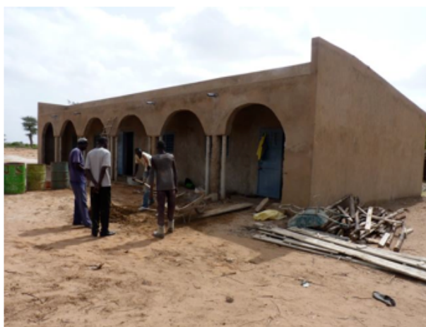
Déjà 2 classes de construites