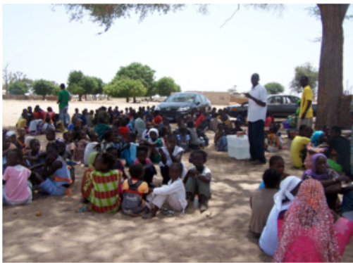
Tous en place pour déjeuner ! préparent le repas

L'école primaire était notre premier objectif. Cinq ans plus tard, les enfants qui ont bénéficié de l'aide des Crayons d'Isa dès 2008, sont maintenant prêts à rentrer au collège. Nous ne pouvions pas les abandonner en si bon chemin !